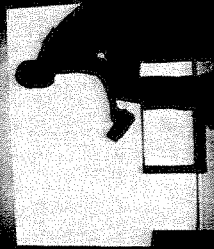
kamer 1.